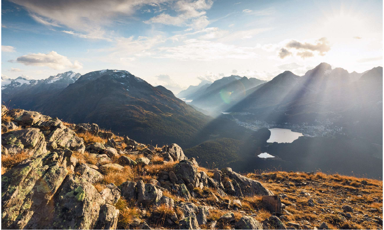
Blick von der Segantini-Hütte am Schafberg ins Oberengadin.